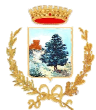
Comune di Valledolmo